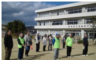
防災安全プロジェクト

図書室運営協力（蔵書・図書環境整備）やお話しの会、秋祭りへの参加などの活動をしている。