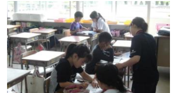
放課後先生の積極的活用