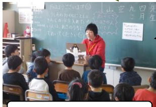
読書支援プロジェクト

図書室運営協力（蔵書・図書環境整備）やお話しの会、秋祭りへの参加などの活動をしている。