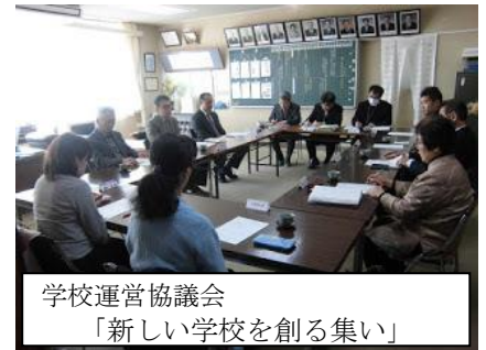
学校運営協議会 「新しい学校を創る集い」