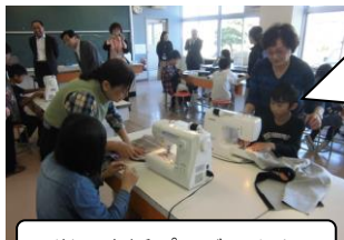
学習支援プロジェクト

総合的な学習の時間（いきいきタイム）に地域の方を講師に招き、地域の教育力を学習に生かす。 教科等の学習に「しばった子応援団」や仙台大学学生の支援をいただく。