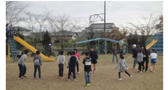
縦割り活動の積極的推進