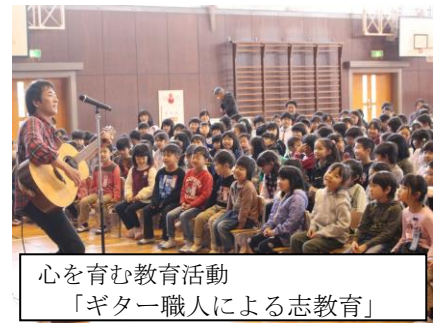
心を育む教育活動 「ギター職人による志教育」