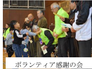
ボランティア感謝の会