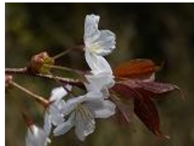
（ ? ）

問 28 仙台大学付近からヨークベニマル付近までのびる新栄通りには、桜の幼木が約100本あります。多くの外灯があるので夜でも明るいことから、桜の幼木に珍しいことが起こります。それは、どんなことでしょうか？（択一）