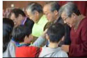
ボランティア活動の充実