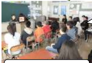
読書支援プロジェクト

図書室運営協力（蔵書・図書環境整備）やお話しの会、秋祭りへの参加などの活動をしている。