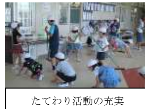
たてわり活動の充実