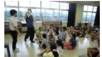
SAKURA PROJECT の推進