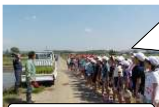
学習支援プロジェクト

総合的な学習の時間（いきいきタイム）に地域の方を講師に招き、地域の教育力を学習に生かす。 教科等の学習に「しばった子応援団」や仙台大学学生の支援をいただく。