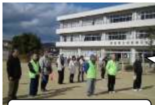
防災安全支援プロジェクト

図書室運営協力（蔵書・図書環境整備）やお話しの会、秋祭りへの参加などの活動をしている。